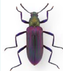
Een insect heeft altijd een kop, een borststuk, een achterlijf en 6 poten.

Vleugels van vliegtuigen zijn op een speciale manier gebouwd: boven de vleugels beweegt de lucht sneller dan onder de vleugels. In snelle lucht is de luchtdruk lager dan in langzame lucht. Door het verschil in luchtdruk ontstaat een lift en stijgt het vliegtuig op.