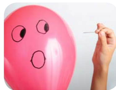
De luchtdruk in de ballon is veel hoger dan de luchtdruk buiten de ballon.